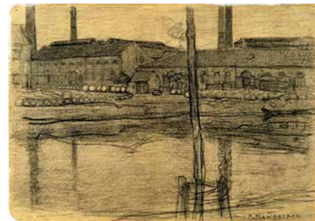
De Koninklijke Waskaarsenfabriek aan de Boerenwetering (de latere Hobbemakade) Een vroege tekening van Piet Mondriaan ca 1899.

Na de sloop van de waskaarsenfabriek in 1910 werd in de loop van de jaren de nog aanwezige prostitutie weggeboord naar de overkant van het water waar ze langs de Ruysdaelkade nog steeds is aan te treffen. De grond van de wijk werd verstevigd met het zand uit het IJ en de wallen van de Boerenwetering werden verstevigd. Vanaf de jaren '20 van de vorige eeuw is er flink geïnvesteerd om de buurt klaar te maken voor de aansluiting met het inmiddels opkomende chique Amsterdam-Zuid. Gelukkig is die er gekomen en behalve de naam doet niets zich nog aan de schrijnende toestanden van weleer herinneren. JB