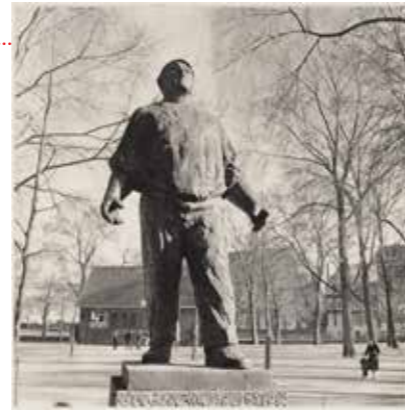
De Dokwerker, Jonas Daniël Meijerplein

In 1946 werd de Februaristaking voor het eerst herdacht, nog niet op het Jonas Daniël Meijerplein, maar tegenover de Mozes & Aäronkerk op het Waterlooplein. Pas in 1950 verplaatste men de herdenking naar het Jonas Daniël Meijerplein. Nog zonder de Dokwerker, het bronzen beeld werd pas 1952 onthuld. De Dokwerker van Mari Andriessen stelt