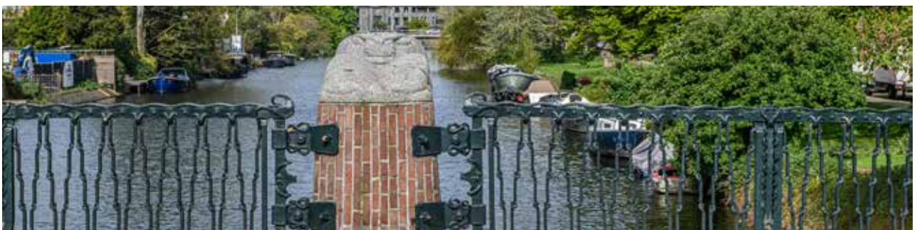
De Timo Smeehuijzenbrug