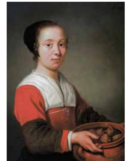
A. Cuypp: Vrouw met olieballen , ca 1652

We waren zó blij met het leuke stukje over de geschiedenis van de oliebol in de decemberkrant, dat we helemaal over het hoofd zagen dat het jaartal in het bijschrift niet klopte. Eén cijfertje in het jaartal maakte een duikeling: natuurlijk was het niet 1952, maar circa 1652 dat Aelbert Cuypp deze 'Vrouw met schaal olieballen' schilderde! Het hangt overigens nog steeds in het Dordrechts Museum.