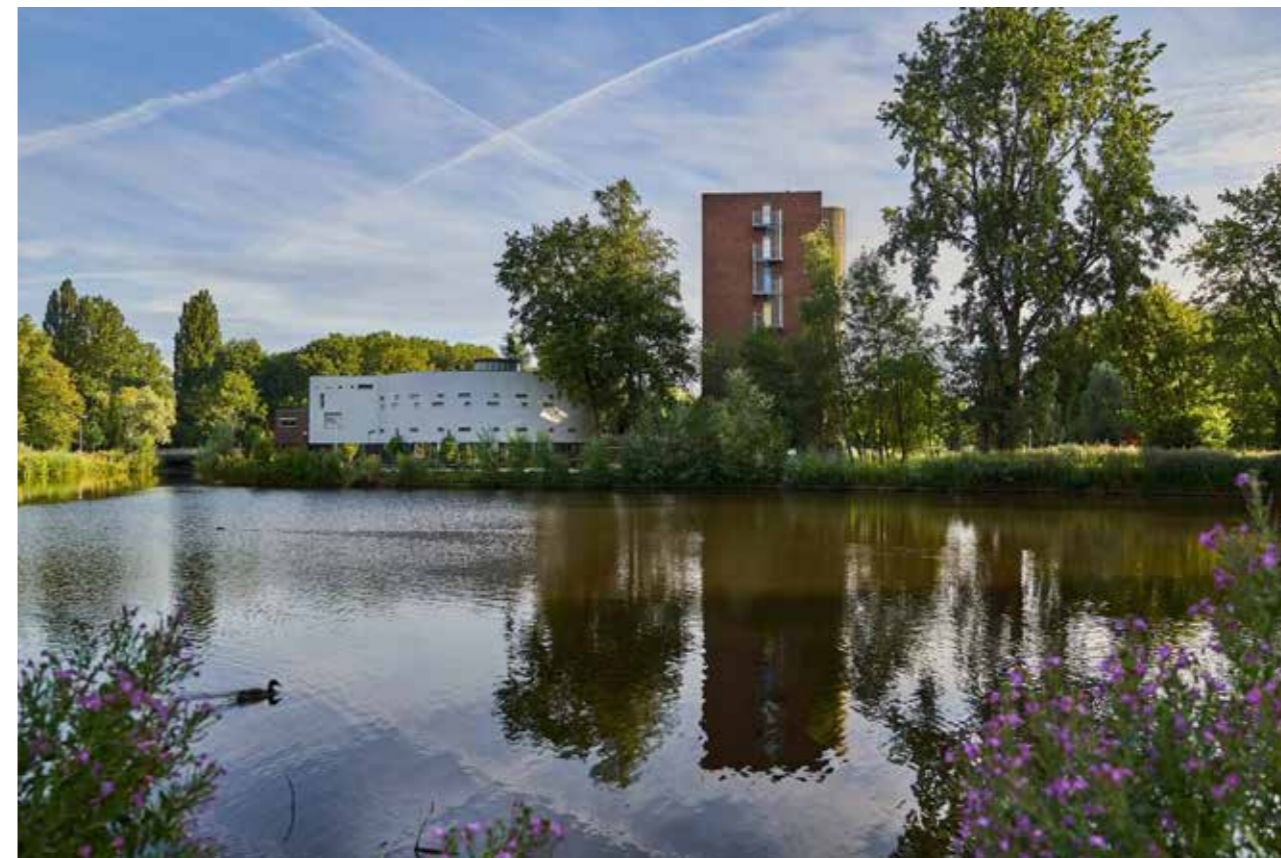
Kapel en Convict 2019.

Hoeveel inwoners van ons lezerspubliek hebben niet een band met het St Nicolaaslyceum aan de rand van het Beatrixpark? Deze middelbare school is immers een begrip in Amsterdam-Zuid. In 1959 opende zij de schooldeuren als katholiek lyceum voor jongens onder de hoede van de priesters die waren gehuisvest in het naastgelegen klooster. Vanaf de jaren ‘80 van de vorige eeuw nam het aandeel van de religie in het onderwijs t.o.v. van het seculiere af en stelde ook deze de school zich open voor meisjes. Inmiddels staat de school open voor alle religies. Sinds 2012 is het Nicolaas gehuisvest in een nieuw gebouw bij de hoek van de Beethovenstraat, op de plek waar van 1968 tot 2010 de rooms-katholieke Christus’ Geboortekerk stond.