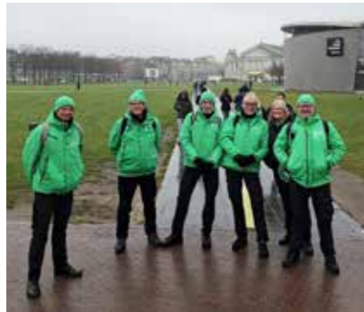
De fietscoaches van het Museumplein

Al een paar jaar is het voetgangers en bewoners rondom het Museumplein een doorn in het oog dat veel fietsers de lichtstreep over het Museumplein gebruiken als fietspad. Ook langs de museumkant en dwars over de klinkervoetpaden wordt veelvuldig gefietst. Groepen toeristen o.l.v. een gids fietsen in de zomer dagelijks over het grasveld. Nergens staat dat dit verboden is en blijkbaar bedenkt men niet dat fietsen op of over een groen stadspan waar gewandeld wordt niet gewenst, noch sociaal is. Terwijl er wel degelijk langs de andere, rechterzijde van het Museumplein