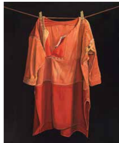
Jopie Huisman, Roodbaaien hemd, 1975.

Voor informatie en boeken: groengrijs.com, tochten in de planning. Online aanmelden gaat het snelst. Geen internet en geen mensen in uw naaste omgeving die u kunnen