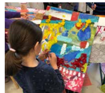
Creatieve kinderen