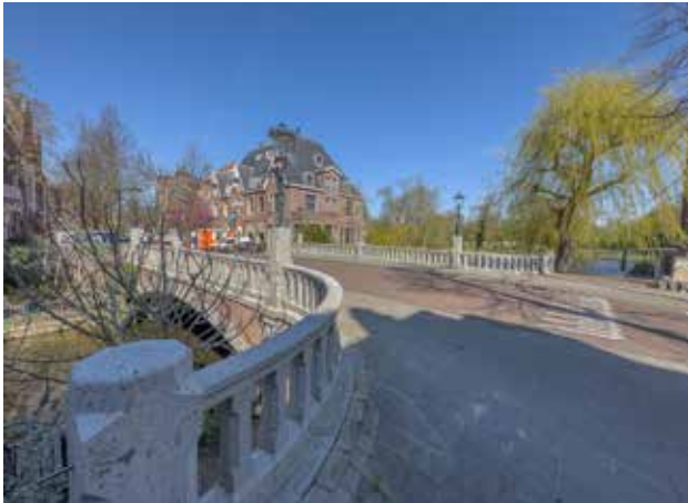
De Anna Paulownabrug