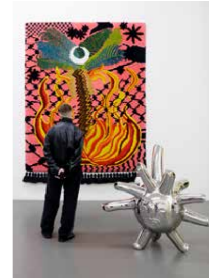
Susanne Khalil Yusef: A last glance (2024) en Uitschieter (Rootpusher, 2023)

wortelachtig figuur met verwrongen glimlach in glimmend metaal, symbool voor de migrant die probeert voet aan de grond te krijgen.