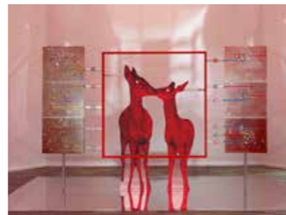
Katja Novitskova, 'Pattern of Activation (Deers Kissing, Vision Mode)', 2023, coll. Stedelijk Museum

Het Stedelijk organiseert om de twee jaar een grote groepstentoonstelling over een discipline of urgent thema. De huidige editie richt zich op ontwikkelingen op het gebied van fotografie, een medium dat voortdurend in ontwikkeling is met werken die de kruising van de beeldende kunst en fotografie benadrukken. Anders dan het klassieke fotopapier worden textiel, canvas, steen, een driedimensionale installatie of bewegend beeld gebruikt. Er werden 21 internationale kunstenaars