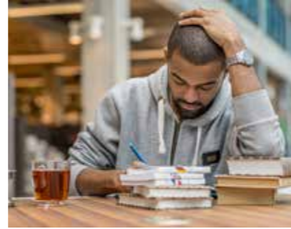
Schrijven in de bibliotheek

Aanmelden voor de schrijfworkshop kan door een e-mail te sturen naar buurtzuid@oba.nl. Lukt het niet in maart? Geen probleem, elke eerste zaterdag van de maand start een nieuwe reeks lessen. Let wel: voor de schrijfworkshop zijn kosten verbou-