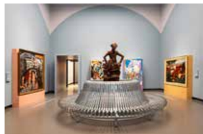
CATPC, 'Two Sides of the Same Coin', Van Abbemuseum, 2024.

In het Van Abbemuseum is 'Two sides of the Same Coin' te zien met werken van het Congolese kunstenaarscollectief CATPC in combinatie met werken uit de collectie van het Van Abbemuseum. De kunstenaars van het collectief leven op een planta-