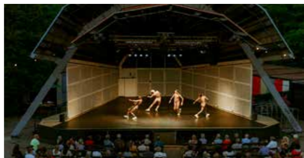
Vondelpark Openluchttheater Fluermulder

Tijdens hun slotoptreden, afgelopen zomer, deden Acda en De Munnik een oproep het Vondelpark Openluchttheater niet in de steek te laten. Het leek er namelijk even op dat de 50ste verjaardag van dit unieke evenement ook laatste editie zou zijn. Die oproep is massaal gedeeld en de organisatie ontving vele hartverwarmende reacties via website, Instagram en mail. Als er ooit getwijfeld werd aan het belang van het Vondelpark Openluchttheater voor Amsterdam, dan is een greep uit alle verhalen van bezoekers en artiesten voldoende om de mensen achter dit unieke festival weer op de juiste koers te brengen.