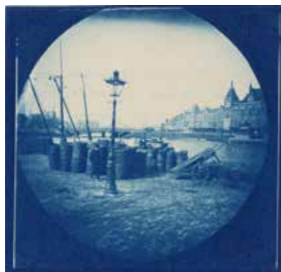
Cyanotypie Centraal station

per John Herschel naar een reproductiemethode waarbij hij papier lichtgevoelig maakte. Door teksten