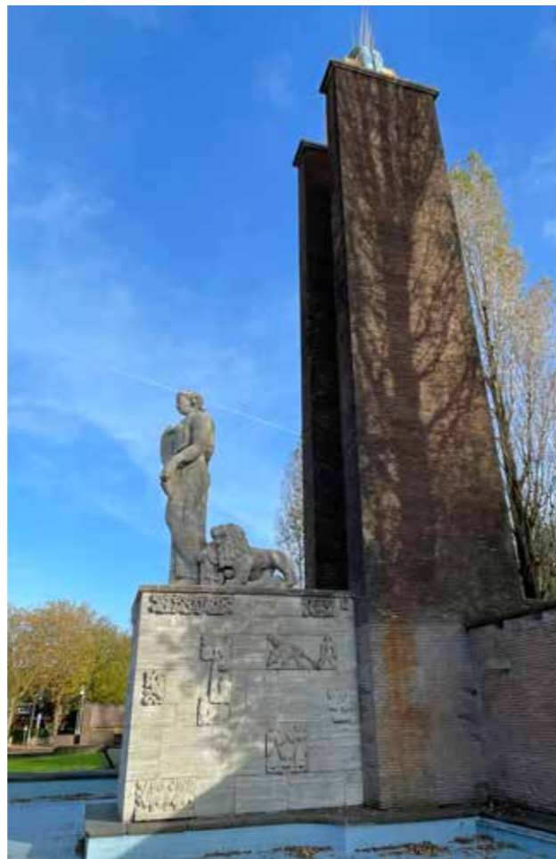
Herinneringsmonument Indië-Nederland 1596-1949.