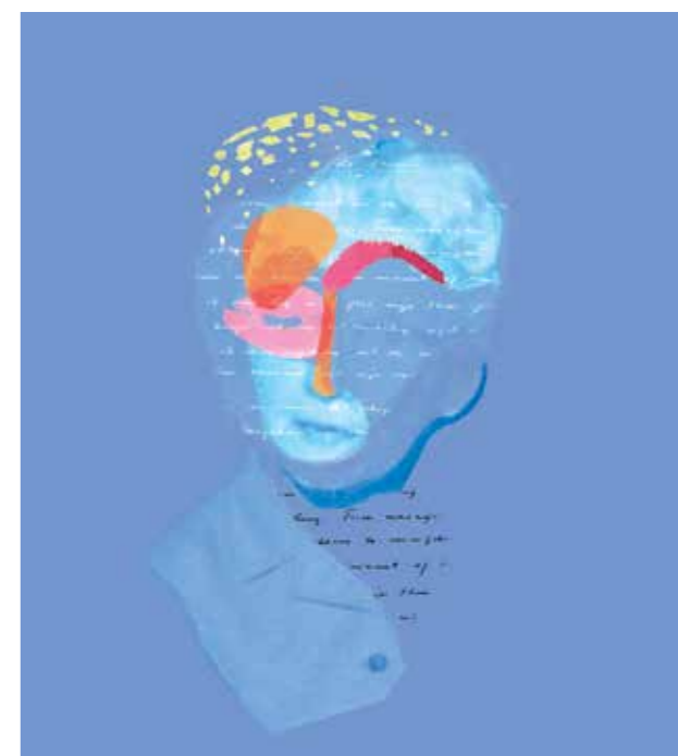
OBA, Ode aan een vrouw. Afbeelding: Iris van Frankhuizen

De laatste bijeenkomst is op 15 januari in ontmoetingscentrum De Coenen om 19.30 uur. Dan presenteren de deelnemers van het project de Odes aan het publiek. We organiseren een tweede serie Ode aan de vrouwen op 23 en 30 januari in de OBA (19.30 tot 22.00 uur). Doet u mee? Meld u aan bij: buurtzuid@oba.nl . FdP