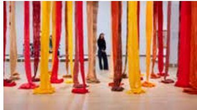
Cecilia Vicuña, 'Quipu Austral' (2012)

In de kunstgeschiedenis werden textielkunstenaars lang niet serieus genomen. Rond 1965 kwam daarin verandering door vier vrouwelijke avant-garde kunstenaars, die in het Stedelijk exposeerden met monumentale en confronterende abstracte werken, bijvoorbeeld Cecilia Vicuña (1948, Santiago, Chili), met 'Quipu Austral' (2012). Wereldwijd hebben hedendaagse kunstenaars textiel herontdekt als middel om persoonlijke en maatschappelijke verhalen te vertellen. De tentoonstelling 'Unravel – The Politics and Power of Textiles in Art' bestaat uit circa 100 werken. Ze bevatten een scala aan vormen en formaten, soms gebaseerd op historische technieken of juist op nieuwe, experimentele processen. Bijzonder is een werk van Tau Lewis (1993, Toronto, Canada), 'The Coral Reef Preservation Society' (2019), een wandtapijt waarop zij het bedreigde koraalrif afbeeldt met hier en daar een lichaamsdeel van de bedreigde zwarte mensen, omgekomen tijdens de trans-Atlantische slavenhandel. Het werk van veel internationale kunstenaars is nog niet eerder in Nederland getoond. De kleurrijke overrompelende werken vertellen verhalen over macht en verzet, maar ook over, liefde en hoop. Alleszins de moeite waard voor een bezoek. Kan nog t/m 5 januari 2025. DB