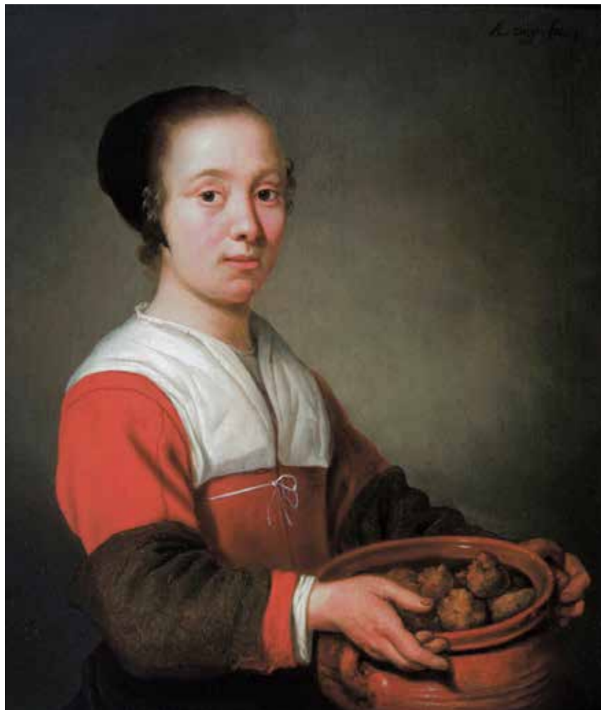
Aelbert Cuyp: Vrouw met schaal oliebolletjes, ca 1952. Collectie Dordrechts Museum

hetzelfde jaar 1492 Columbus geleid naar het tot dan onbekende Amerika met haar rijkdommen. De katholieke heersers waanden zich het uitverkoren volk en dat heeft het Joodse gedeelte van de Iberische bevolking geweten. Degenen die konden vluchten zochten hun heil in onder andere de Lage Landen (België en Nederland). Deze Sefardische Joden hebben veel van hun traditionele recepten meegenomen, waaronder ook die van de oliekoeken als onderdeel van Chanoeka, het Joodse feest van de lichten dat in onze decembermaand wordt gevierd. De olie zou een verwijzing zijn naar de olie in de eeuwig brandende lamp in de tempel van Jeruzalem.