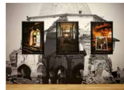
Werk van Rushdi Anwar

Anwar vertelt verhalen die hun oorsprong hebben in het historische Koerdistan. Een gebied waar lange tijd een diversiteit aan culturen en religies samenleefde: Jezidi, Shabakken, Assyriërs, verschillende stromingen christenen en Arabische