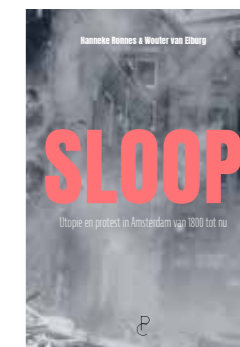
Sloop bevat 238 pagina's en 46 illustraties, te bestellen voor € 24,90 bij uitgeverij Panchaud, www.panchaud.nl

Nu Oud-Zuid in een sloopgolf zit, is het belangrijk te bedenken dat na sloop vaak spijt volgt. Denk hierbij aan de gesloopte, iconische Sandbergvleugel van het Stedelijk Museum en aan de woningen in de mooie, rond 1900 gebouwde Van Eeghenstraat. Of aan wat wel behouden bleef dankzij protest- en kraakacties, van het Olympisch Stadion tot het woonhuis van Etty Hillesum aan het Museumplein.