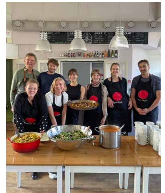
Dit is het enthousiaste Lydia team van BuurtBuik. Er kunnen nog wat helpende handen bij!

Maureen zou nog wel wat vrijwilligers erbij willen hebben om de organisatie nog soepeler te laten verlopen: "Wie interesse heeft om, naar wens bij toerbeurt, onze enthousiaste ploeg te komen versterken is van harte welkom!" Aanmelden kan via oudzuid@buurtbuik.nl . Team BuurtBuik Amsterdam Oud-Zuid in Huis van de Wijk Lydia IO/CP