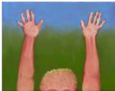
Miriam Cahn, 'könnteichsein' (2022)

Er zijn zo'n honderd schilderijen en tekeningen, verdeeld in vier ruimtes. Bij 'Alleen lichamen' hangen op ooghoogte naakte of schaars geklede lichamen, vaak zonder specifieke identiteit of herkenbaar gender, met voelbare emoties als verdriet, agressie, angst. In de ruimtes 'Wreedheden' en 'Onafbeeldbaar' vloeien oorlogsmisdaden, raciale conflicten, machtsmisbruik en seksueel geweld in haar werk samen. Portretten van gewonden, van mensen op de vlucht, aangespoelde lichamen. Een tekening van de moord op de Afro-Amerikaanse George Floyd door een witte politieman. Een vuist die keihard een geboeid lichaam raakt, waarbij alleen de vuist scherp is omlijnd, verkrachting van een geknevelde persoon. Een klein kabinet bij de ruimte 'Huilen moeten' is gewijd aan de aanval van Hamas op Israël op 7 oktober 2023. Behalve verdriet, roepen de beelden ook wanhoop en machteloosheid op. 'Weinen müssen' staat voor het moeten huilen en niet meer kunnen