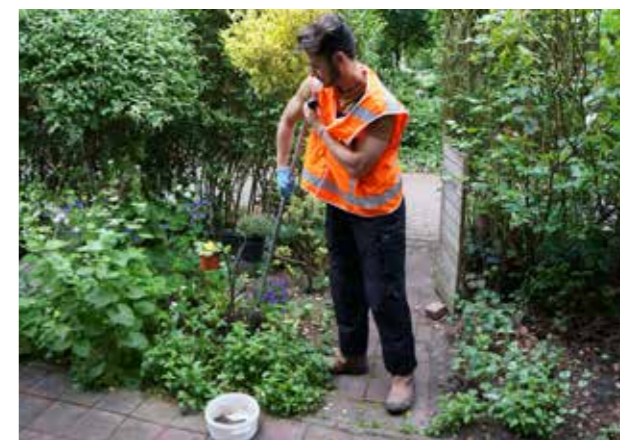
Uitvoering lood-check.

Lood is slecht voor de ontwikkeling van de hersenen. Daardoor kunnen problemen met leren ontstaan bij jonge kinderen tot 7 jaar. Vroeger wist men niet dat lood gevaarlijk is. Het werd veel gebruikt, bijvoorbeeld in benzine, verf, aardewerk en bij metaalbewerking en bouwmaterialen zoals dakpannen. Hierdoor is lood in de grond terechtgekomen. Ook kan het in grond zitten van vroegere opgehoogde bouwterreinen. In Zuid wordt daarom het meeste lood verwacht in de Pijp, Oud-Zuid en bij de Amstelveenseweg.