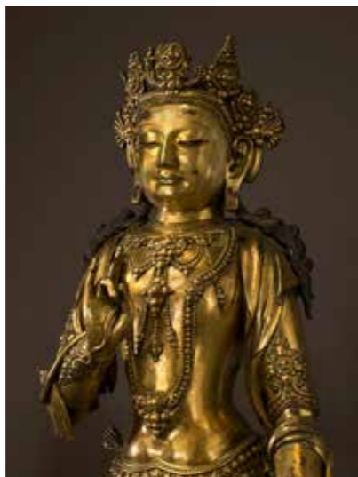
Bodhisattva, China, 1403-1424. Musée Cernuschi, Parijs

Met de tentoonstelling Aziatisch brons. 4000 jaar schoonheid zijn in het Rijksmuseum meer dan 75 bronzen topstukken bijeengebracht. Van prehistorische objecten tot hedendaagse kunst uit India, China, Indonesië, Japan, Thailand, Vietnam, Pakistan, Nepal en Korea. De meeste werken zijn voor het eerst in Nederland te zien. Beelden van onder anderen Boeddha, Shiva en Vishnu laten op indrukwekkende wijze zien hoe in brons de hemel op aarde werd verbeeld. Alle zintuigen worden geprikkeld met bronzen spiegels, wapens, bellen, wijnvaten en wieroekbranders, vaak spectaculair weergegeven in de vorm van leeuwen, olifanten of fabeldieren.