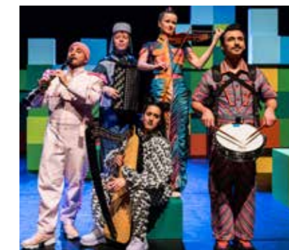
Familievoorstelling 'Tempo' van Oorkaan Ensemble voor 7 tot 107 jaar.

Deze editie maakt ruim baan voor alle generaties musici en componisten, van schoolensembles tot de strijkers van Amsterdam based Roctet , in nieuwe muziek van 90+ componist en buurtbewoner Theo Loevendie. Vijf dagen feest, verspreid over de wijken in Zuid: de Concertgebouwboulevard, De Pijp, Beatrixpark, Zuidas, rond het Roelof Hartplein, Olympiaplein en het Vondelpark! Voor meer informatie en kaartverkoop, ga naar www.muzevanzuid.nl .