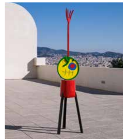
Personnage, 1967. Beschilderd brons, Fondation Joan Miró.

Geldig op vrijdag 27 september: Kosten bustocht: € 15 t/m 45 deelnemers, € 14 vanaf 46 deelnemers.