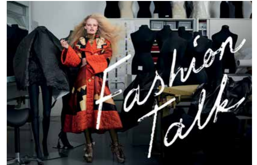
Fashion Talk

Speciaal voor anderstaligen in de buurt is de OBA op het Roelof Hartplein gestart met het Taalcafé. Deze activiteit is voor anderstaligen om op een leuke en spellende wijze de Nederlands taal te oefenen. Ontmoeting bij het leren van de taal staat centraal. Onder het genot van een kop koffie of thee leren deelnemers nieuwe mensen kennen. De activiteit vindt elke donderdag plaats van 14.30