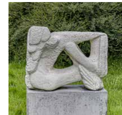
Beeld: Ben Guntenaar Foto: Date van Utteren

Op een ochtend verpoosde Leda bij een beekje waar een prachtige witte zwaan haar gezelschap kwam houden. Hij vlijde zich op haar schoot en keek Leda smachtend in de ogen waardoor de koningin in trance raakte en de oppergoddelijke zwaan haar overmeesterde. Na de geslachts-gemeenschap zwom de zwaan statig weg. Doodsbang voor de gevolgen van deze gebeurtenis, verleide Leda nog diezelfde avond haar man tot de liefdesdaad. Gewoon, voor het geval dat. En dat geval deed zich negen maanden later voor: Leda beviel van een kinderscharre waarvan een deel uit eieren kwam en anderen niet. In die tijd was een bevalling omgeven door mystiek en met die gebroken eieren erbij natuurlijk ook nog een grote janboel. Twee jongetjes waren als een tweeling elkaars evenbeeld en zij kregen de namen Kastor en Pollux. De broers waren hun leven