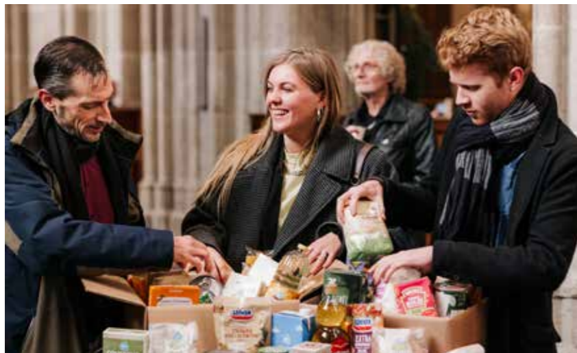
Kerk in Actie

De Voedselbank Amsterdam voorziet wekelijks ruim 4500 personen in Amsterdam van een voedselpakket. Daarmee wordt de strijd tegen armoede aangegaan. Intussen wordt het steeds lastiger voor de Voedselbank om aan producten te komen. Supermarkten en bedrijven hebben hun inkoopbeleid aangepast om voedselverspilling tegen te gaan, wat betekent dat zij minder producten aan de Voedselbank geven.